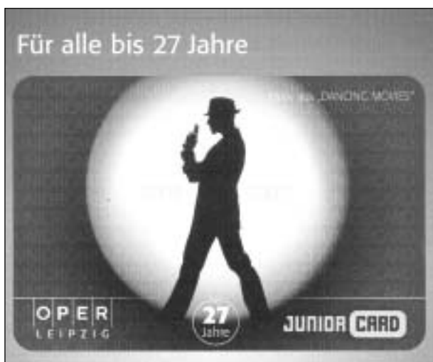
Bereits nach der zweiten Vorstellung lohnt sich die Junior Card

Die Junior Card der Oper Leipzig ermöglicht günstige Eintrittspreise