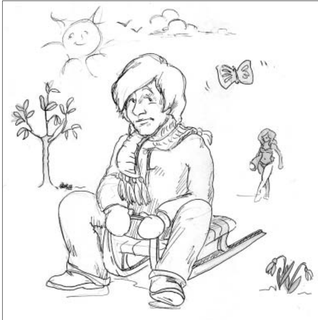
Schwitzen für den Winter