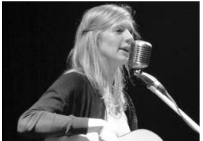
Auch musikalisches Talent war gefragt