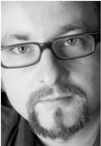
Regisseur Falko Schuster

Ein Dokumentationsfilm über den Lebensweg von Geschwistern in der BRD und DDR