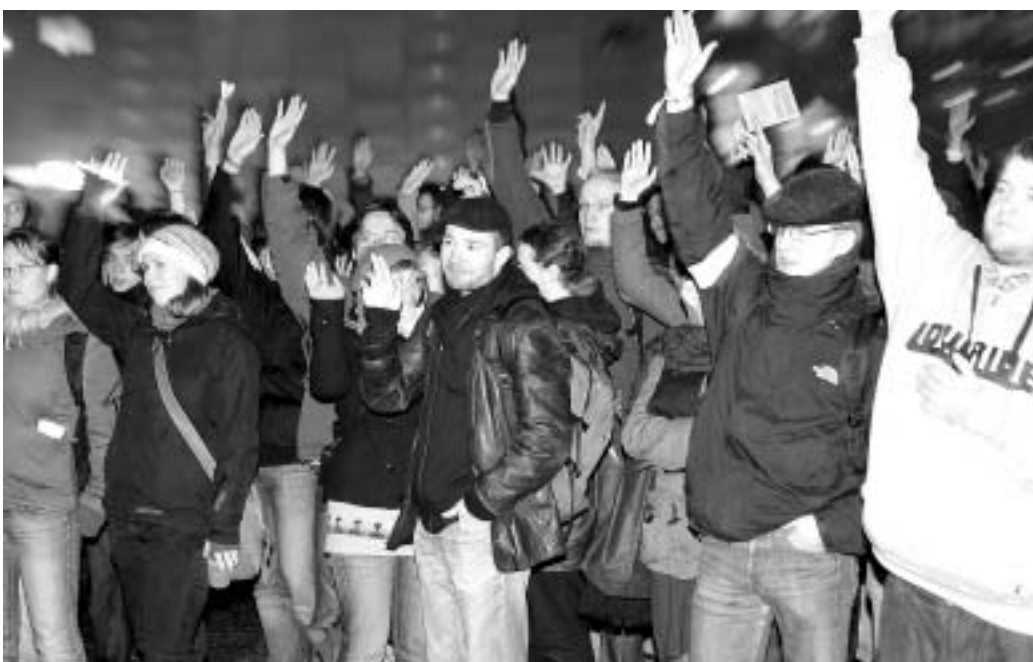
Auch Leipziger Studierende protestieren

Studenten und Opposition kritisieren Änderungen am Sächsischen Hochschulgesetz