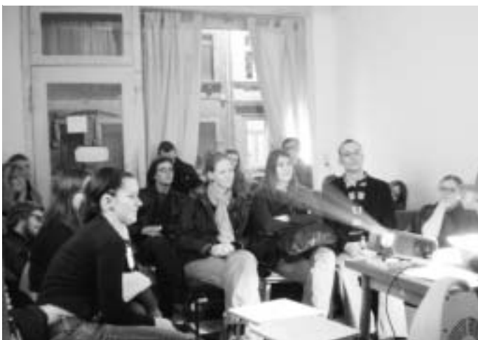
Jeden Dienstag treffen sich die Studenten im doppelplusgut

Studentische Initiative schafft sich selbst einen Raum für Veranstaltungen