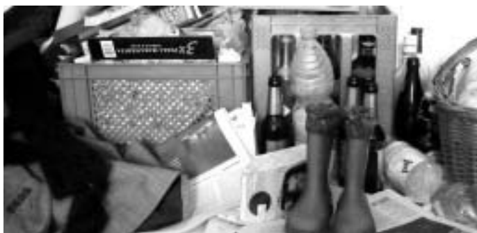
Das wird zu Geld

Insgesamt gibt es 16 Studentenwohnanlagen vom Leipziger Studentenwerk, die von bis zu 32 Wohnheimsprechern betreut werden. Sie sind die Ansprechpartner vor Ort bei Angelegenheiten rund ums Wohnheim, vor allem in den ersten Wochen. Die Arbeit erfolgt zusammen mit Tutoren, die in erster Linie für ausländische Studenten zuständig sind. Seit 2007 wird jährlich eine Zufriedenheitsumfrage durchgeführt, die durchweg positive Resonanz aufweist. Weitere Infos zum Thema Wohnheim: www.studentenwerk-leipzig.de .