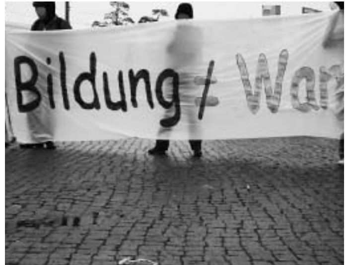
Diskussion über Bildung nicht hinter verschlossenen Türen führen

Obwohl Merkel die Ministerpräsidenten damit enttäuschte, die Ausgaben für die Bildung aus dem Bundeshaushalt nicht zu erhöhen, scheint der Bildungsgipfel für alle Beteiligten ein voller Erfolg. „Wir sind heute einen wichtigen Schritt auf dem Weg zur Bildungsrepublik