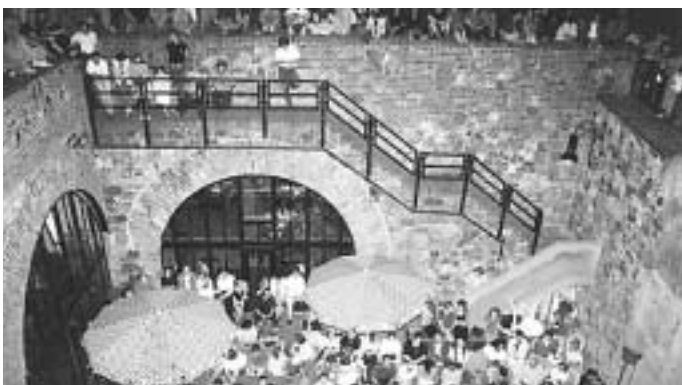
Dichtes Gedränge in sanierungsbedürftigem Gemäuer

Bereits 2003 stellte ein Gutachten erhebliche Mängel fest