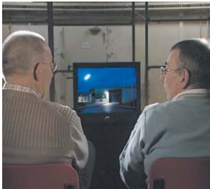
Hüben und drüben vor dem Fernsehen

Wer auf den Film neugierig geworden ist, muss sich leider noch gedulden. Im Frühjahr 2009 soll der Film im MDR-Fernsehen im Spätabendprogramm laufen. Ein genauer Sendetermin lag bis Redaktionsschluss nicht vor.