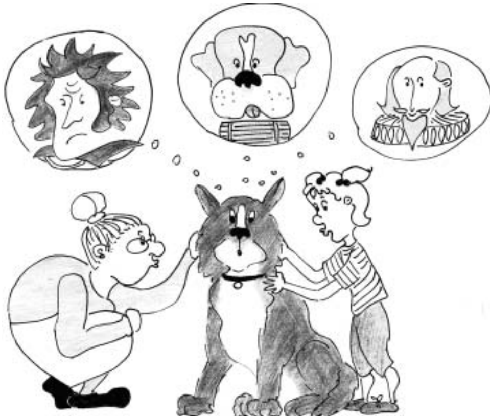
Freudiges Betätscheln von Shakespeare