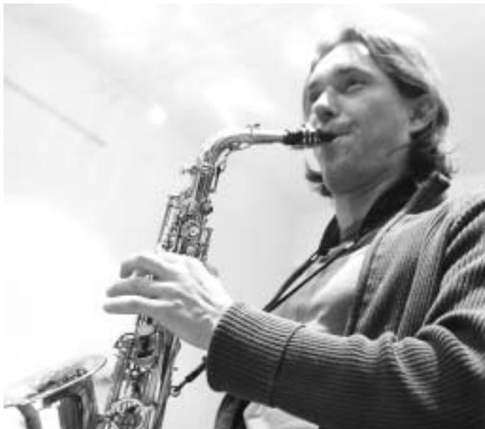
Saxophon, ein typisches Bigband-Instrument

Die Leipziger Uni-Bigband bietet Jazz in seiner ganzen Vielfalt