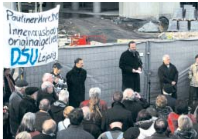
Die Kundgebung am Reformationstag

Beschlossen wurde der Bau der 16 Meter hohen Plexiglaswand, die von dem Architekten Erick van Egeraat entworfen wurde, bereits am 30. September von der Universitätsleitung. Seitdem gibt es Proteste von dem Aktionsbündnis „Neue Universitätskirche St. Pauli“ und von der Theologischen Fakultät der Universität. Das Aktionsbündnis fordert von dem Bau der Plexiglaswand abzusehen und eine stärkere geistliche