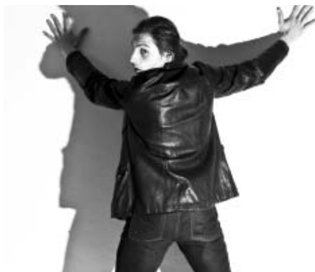
An die Wand gestellt

Das Bild der 68er ist geprägt durch eine Vielzahl von Mythen. Doch wie erging es den Protestlern, welche Rolle spielte „der subjektive Faktor“ in der Bewegung? Diese Frage versucht die Theatergruppe TAG mit dem Stück von Daniel Grunewald zu beantworten, das sie in diesem Herbst erstmals auf die Bühne bringen wird. Der junge Autor ist zugleich einer von 13 Schauspielern, die am 21. November bei der Uraufführung des Stückes auf den Brettern der Halle 5 stehen werden. Ergänzt wird das Schauspielensemble durch einen knapp zehnköpfigen Chor, welcher das szenische Geschehen akustisch untermalen soll. Die künstlerische Leitung obliegt Mathias Sterba. Unterstützt wird dieser bei der Regiearbeit von Daniel Schmidt. Die beiden arbeiten schon seit längerer Zeit zusammen, haben jedoch ihren Schaffensschwerpunkt im vergangenen Jahr von Jena nach Leipzig ver-