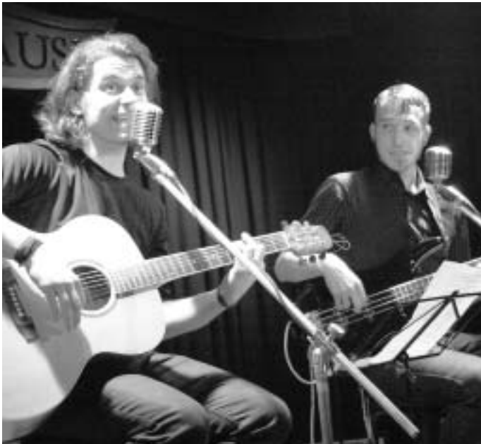
Schleimo-Brothers jonglierten mit Frauennamen