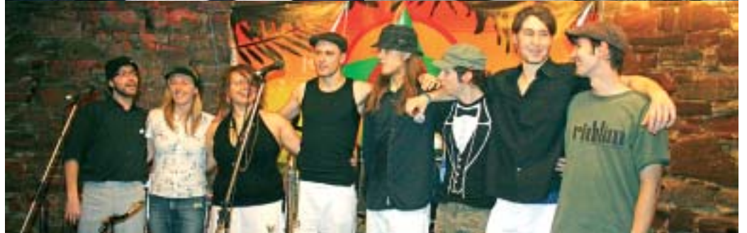
Meikyo (links oben), Racy Rock (rechts oben) und Lick Quarters (unten)