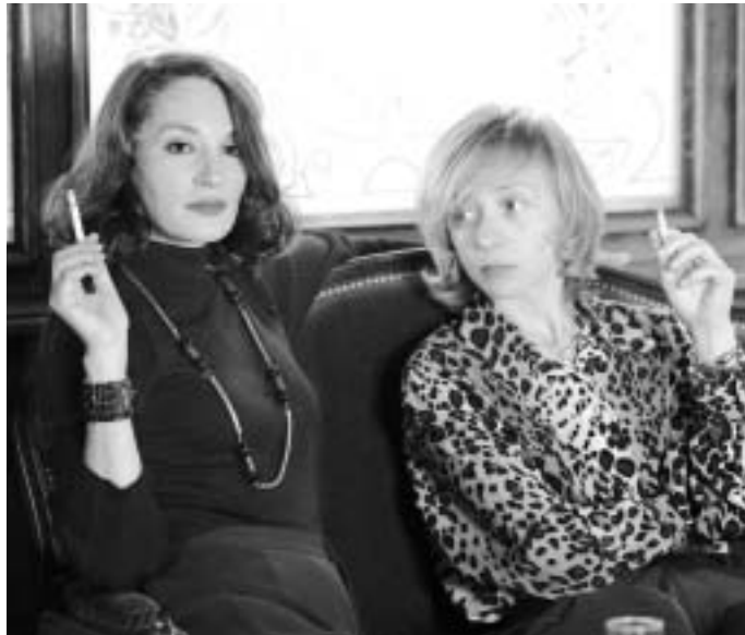
„Bonjour Sagan“ stellt die Autorin Françoise Sagan vor.