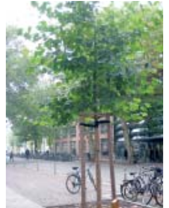
Baum des Fördervereins

Ein Mann soll in seinem Leben bekanntlich drei Dinge tun: ein Haus bauen, einen Sohn zeugen und einen Baum pflanzen. Familienplanung und Hausbau werden häufig umgesetzt, doch Letzteres fällt oft unter den Tisch. Ein Leipziger Student jedoch kann nicht nur für sich selbst behaupten, in seinem Leben schon einen Baum gepflanzt zu haben. Er ermöglicht dies mehreren hundert anderen Menschen ebenfalls.