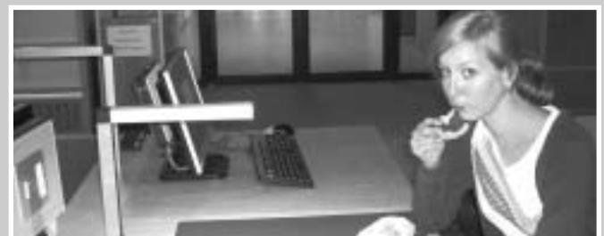
Noch nie war Kekessen so spannend