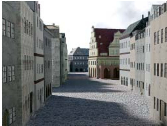
Die Grimmische Straße in Richtung Marktplatz Grafik: Institut für Geografie

Um der Phantasie ein wenig auf die Sprünge zu helfen, entwickelten 13 Leipziger Geografie-Studenten in den vergangenen zwei Semestern ein dreidimensionales Modell des universitären Leipzigs um 1800. Ziel des Projektseminars ist es gewesen, die historische Innenstadt rund um die damaligen Universitätsgebäude zu visualisieren, einen besseren Einblick in die räumliche Struktur und das Lebensumfeld des Universitätspersonals und der Studierenden zu gewähren. „Durch dieses Modell wollten wir uns vor allem kulturgeografischen Fragestellungen nähern: Wie erschafft Erinnerung die Kultur beziehungsweise den historischen Raum?“, erläutern Johann Simo-