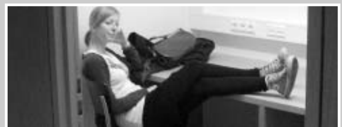
Das nächste Mal nehm ich meinen Gameboy mit