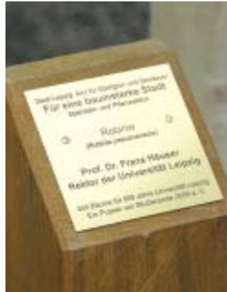
Schild an Häusers Robinie