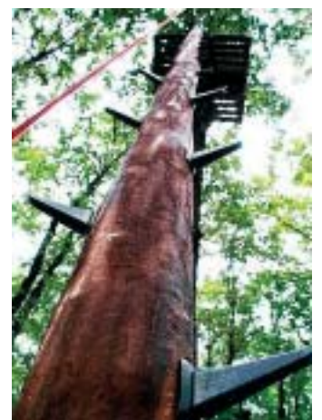
Hoch hinaus

Zum Glück war's nicht der Waldboden, sondern nur ein Netz, welches, dem Werk einer Spinne gleich, zwischen zwei Bäumen gespannt ist. Als ich zum zweiten Mal gegen das Geflecht fliege, greife ich zu und ziehe mich mit letzter Kraft von Masche zu Masche bis zur rettenden Plattform.