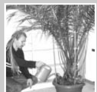
Mit Ihnen reden darf ich ja nicht ...