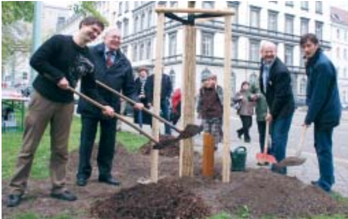
Auftaktpflanzung im Schwanenpark Goethestraße

Pflanzaktion „600 Bäume für 600 Jahre“ geht in die Zielgerade