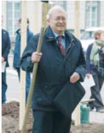
Uni-Rektor Häuser