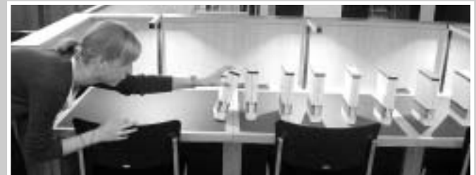
Das wird ein neuer Weltrekord

4) Ausleihen & abgeben, ausleihen und abgeben