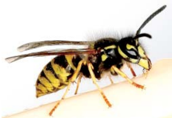
Schwarz-Gelb: Schmerzhaftes Einstiche befürchtet

In Sachsen wird Zweitstudium und „Bummeln“ teuer