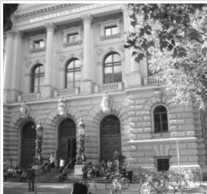
Albertina: Himmel oder Hölle

Warum die Bibliotheca Albertina fasziniert