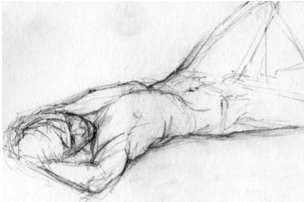
In Posen wie dieser muss Volker oft Stunden ausharren, mit nur wenig Bewegungsfreiraum

Volker: Naja, im ersten Moment war ich schon etwas steif und auch ein wenig überfordert von der Situation, aber ich wusste, es gibt kein Zurück mehr und habe mich dann einfach nackt vor die Studenten gestellt. Eigentlich war es nur am Anfang komisch, als ich nackt zu meinem Platz ging. Als ich auf dem Podest stand, ging es dann.