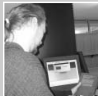
Meine Scan-Bestzeit topt keiner

4) Ausleihen & abgeben, ausleihen und abgeben