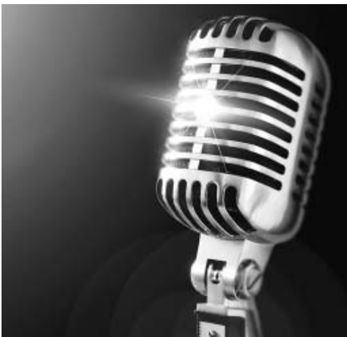
Werbelogo für „Happy Ope(r)n Stage“

Das Deutsche Orient-Institut, seit 2007 mit Sitz in Berlin, wurde im Juni 1960 gegründet und ist die älteste private wissenschaftliche Forschungseinrichtung in Europa, die sich mit dem Nahen und Mittleren Osten beschäftigt. Forschungsschwerpunkte des Instituts sind Politik, Kultur und Wirtschaft des Nahen und Mittleren Osten sowie der islamischen Welt. Mehr Informationen zum Wettbewerb und zu den Bewerbungsmodalitäten unter: www.deutsches-orient-institut.de jse