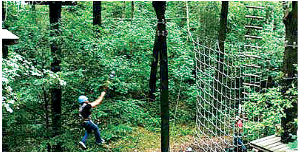
Beim Flug von Baum zu Baum wie Tarzan fühlen

Das Lachen der anderen Kletterer, das Zwitschern der Vögel und die Tiefe - all das nehme ich nicht mehr wahr. Das Einzige, was zählt, ist der