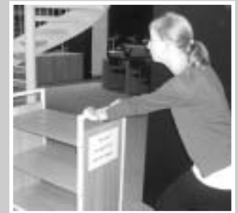
Sport steigert die Konzentrationsfähigkeit