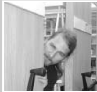
Hier findest du mich nie, Diplomthema