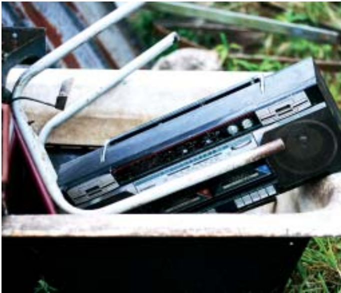
Läuft nur Schrott im Jugendradio?

Akteure der Initiative Biss FM reichen Sammelpetition beim Sächsischen Landtag ein