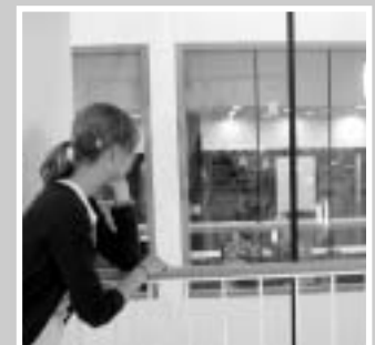
Die schreiben bestimmt auch alle Hausarbeit