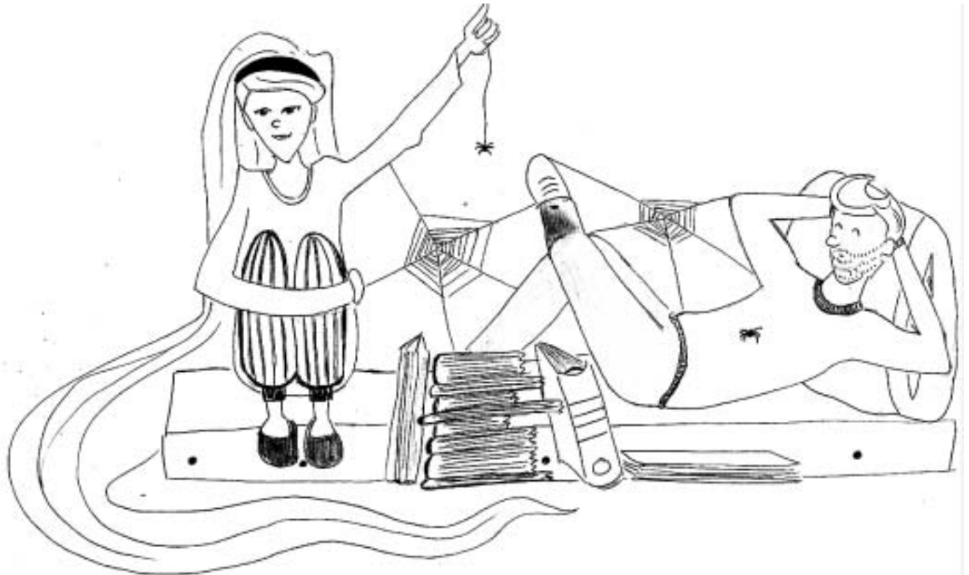
Es war einmal in den Ferien ...

Dass die Initiatoren von BISS FM nicht so lange warten können und wollen, ist verständlich und berechtigt. Eine Alternative zwischen Mainstream und anspruchsvoller, für jugendliche Belange jedoch zu behäbiger Unterhaltung wie sie MDR Figaro bietet, sollte kein Luxus sein in einem Bundesland, das sich sonst immer gern in dem Glanz sonnt, bei der PISA-Studie am besten abgeschnitten zu haben. Martin Engelhaus